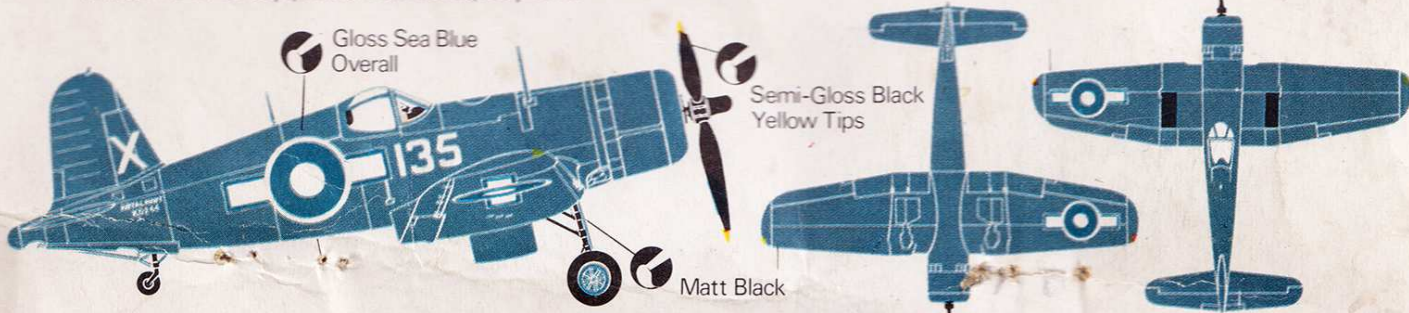
Corsair IV. 1842 Sqn, HMS Formidable, July 1945