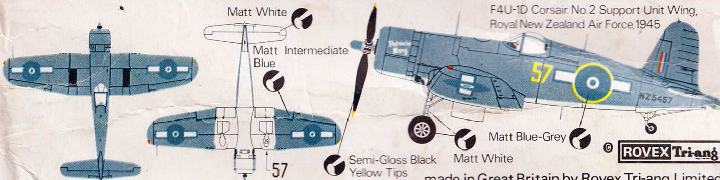
F4U-1D Corsair. No.2 Support Unit Wing, Royal New Zealand Air Force, 1945